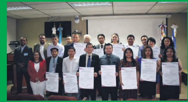
Posgrado FYCIA 2018-2019

Más del 80% de los profesionales absorbidos por el ICTA como investigadores permanentes.