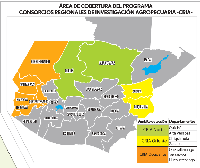
Área de intervención del Programa CRIA y cadenas priorizadas por Región

El Programa Consorcios Regionales de Investigación Agropecuaria (CRIA), fue creado con el objetivo de fortalecer los procesos de investigación realizados por el Instituto de Ciencia y Tecnología Agrícolas (ICTA) y los Centros Regionales Universitarios de una Universidad Pública y dos Universidades Privadas para que de manera conjunta desarrollen investigación aplicada para apoyar el funcionamiento del sector agrícola y rural productivo de Guatemala. Se ejecuta bajo el Convenio de Cooperación Técnica y Administrativa 11-2015 entre el Ministerio de Agricultura Ganadería y Alimentación (MAGA) y el Instituto Interamericano de Cooperación para la Agricultura (IICA) con fondos del Departamento de Agricultura de Estados Unidos (USDA-por sus siglas en inglés).